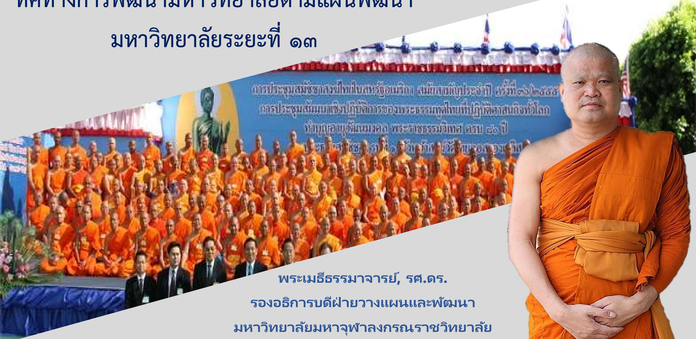
พระเมธีธรรมาจารย์, รศ.ดร. รองอธิการบดีฝ่ายวางแผนและพัฒนา มหาวิทยาลัยมหาจุฬาลงกรณราชวิทยาลัย